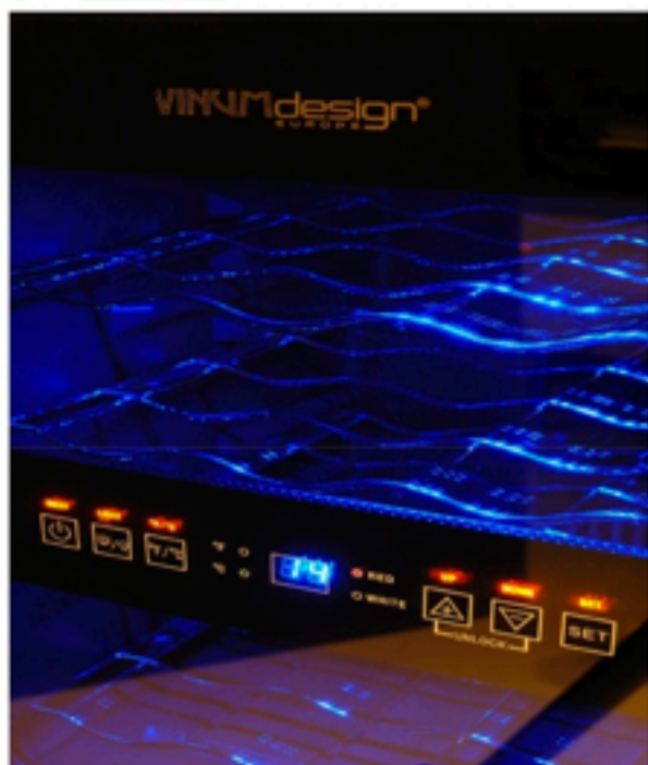
Luce interna Led blu